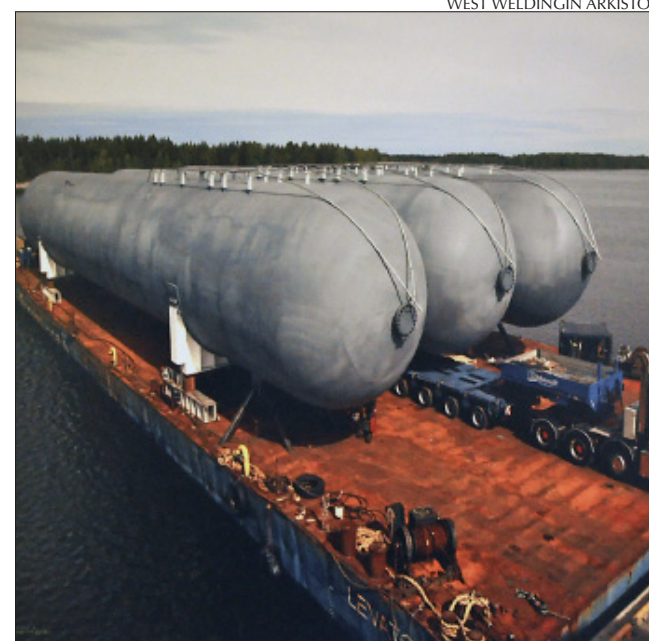
Nämä painesäiliöt West Welding valmisti AGA:n kaasutehtaalle Porvooseen. Kuva on Kaskisten satamasta.