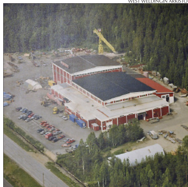
Kuva West Weldingin tontilta silloin, kun päähallin ensimmäistä laajennusta oltiin tekemässä.