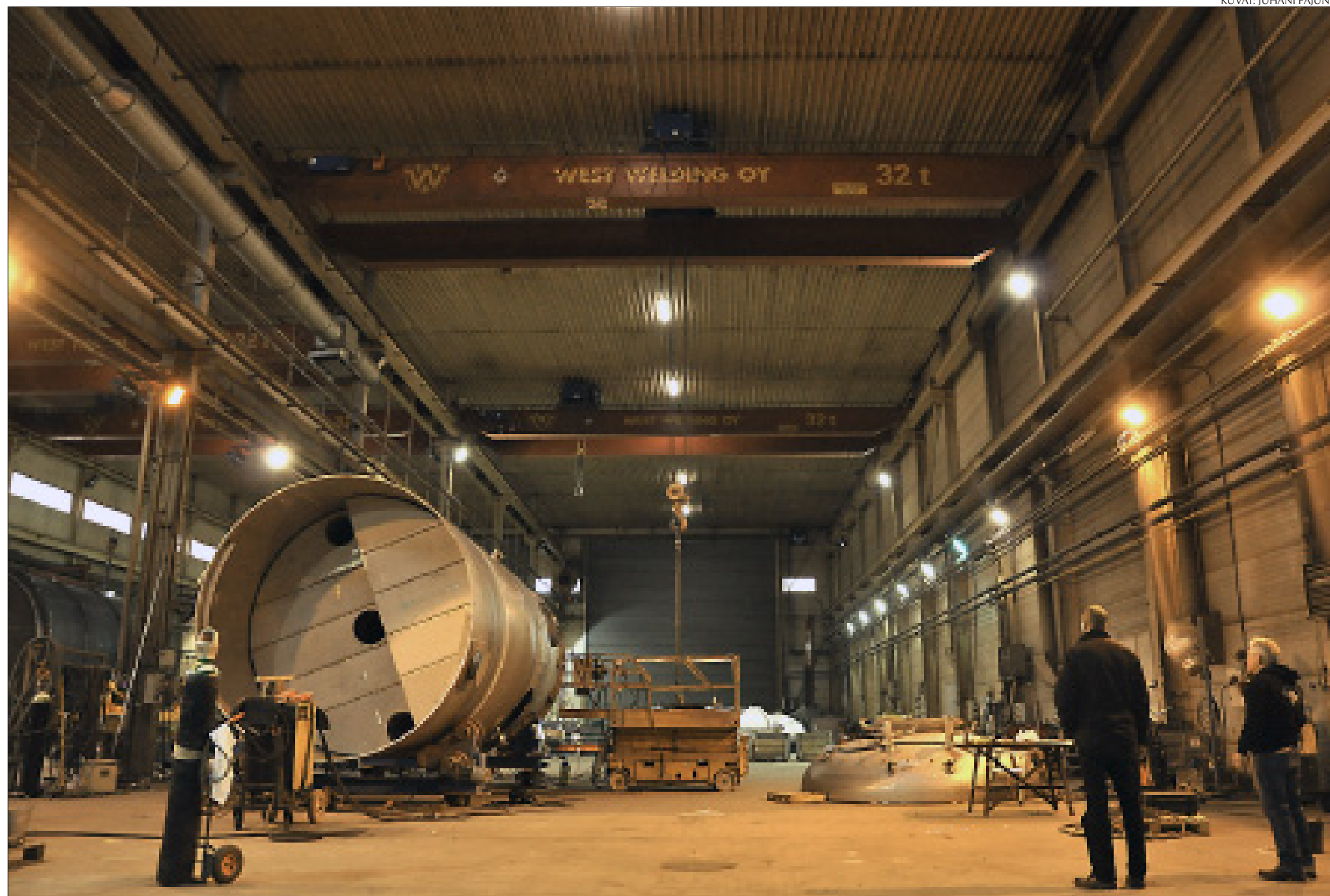
West Weldingin (nykyisin Viafinin) päähalli. Isojen painesäiliöiden rakentaminen vaatii runsaasti tilaa.